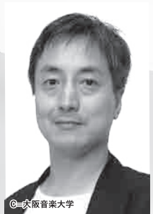
芸術監督・演出 岩田達宗