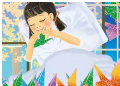
アマイとサダコの祈り