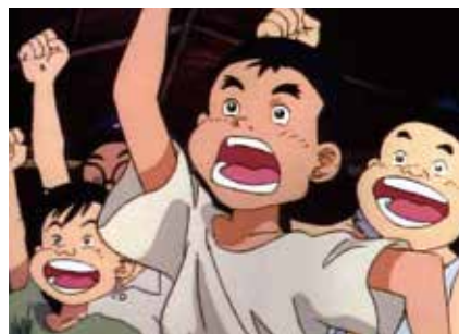
かっ飛ばせ!ドリーマーズ

戦後まもなくの広島、弟と2人で暮らす進は、仲間たちと草野球に熱中していた。広島にもプロ球団ができるというニュースを聞き、進たちも期待に胸をふくらませる…。中沢啓治の漫画をもとに、カープ誕生のエピソードを交えながら、広島の少年たちがたくましく生きる姿を描く。