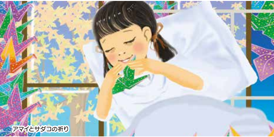
アマイとサダコの祈り

広島とアニメーションとの関わりを再発見し、アニメーションを広島の新しい都市文化の一つとして捉え直す機会となるよう、被爆体験をテーマにしたアニメーション、広島在住のアニメーション作家の作品など、広島ゆかりのアニメーションを特集します。