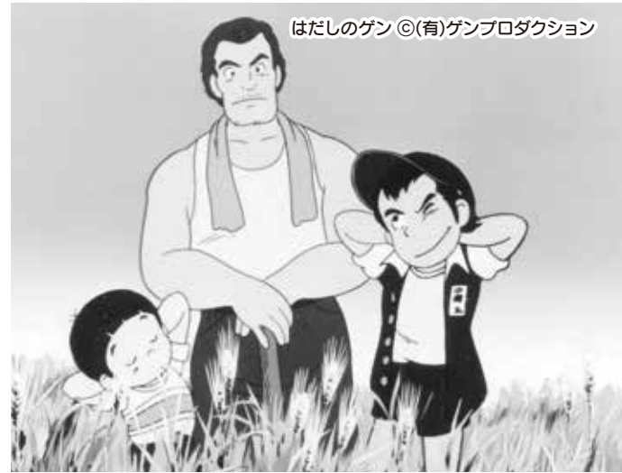
はだしのゲン ©(有)ゲンプロダクション